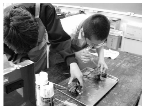
キャブレタの分解組み立ての練習風景

技術科の目指す生徒像は、3年間で学習した内容を、今後の変化する生活スタイルにあわせて、臨機応変に活用できることである。ここでのねらいは、将来的に無公害な電気自動車が広く普及することがのぞまれている中で、生徒達が近い将来に、車を運転する際においてガソリンエンジンを使用した自動車か、モータを使用した電気自動車かを、正しくそれぞれの技術を評価し、環境に配慮して選択できることにある。また現在では、ハイブリッド車が、町中でも多く見ることができ、それは、何故だろうと考えさせる題材にもなり得るからである。