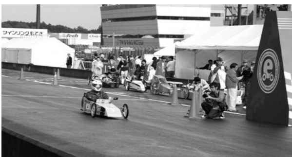
HONDAエコマイレージチャレンジ全国大会の様子

そこでここでは、本校の部活動で取り組んだ、1リッターのガソリンで走らせる「エコカーの製作」を通して、内容Bエネルギー変換の授業で、「熱エネルギーから動力へのエネルギー変換と、ハイブリッド車の役割」について、環境教育についての学習を紹介する。