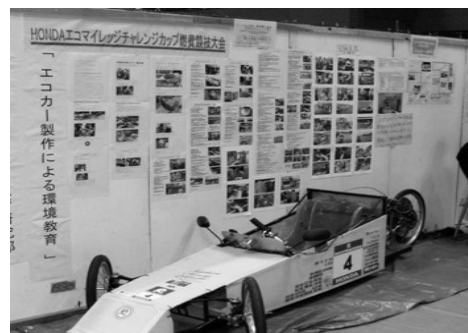
市民文化祭での展示の様子

また授業の中でも、このような体験を学校の仲間が行い発表することで、どのような気持ちで取り組んで来たのかを知り、環境やものづくりに対する知識を得て、エネルギー変換に対する学習意欲を高めることができたと思う。