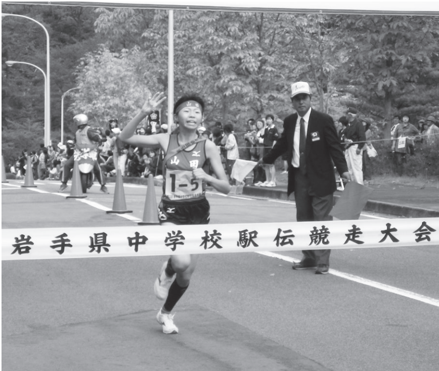
第25回岩手県中学校駅伝競走大会 (花巻広域公園内周回コース)