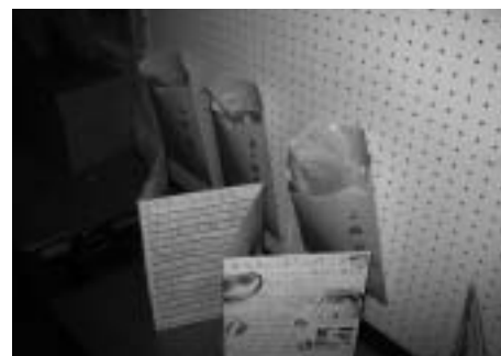
凝縮ポートフォリオと評価カード

本校の職場体験学習では、学年間のシークエンス(連続性)を特に重視している。全学年とも2日間の日程とし、一人で1事業所を体験する。1年生時は、地元の事業所、商店に訪問し、職場体験の基本的なマナーや働くことの難しさに触れさせる。2年生は、本校から車で約1時間の会津若松市内の事業所を中心として一人で体験をする。3年生については、福祉を真剣に考えさせたいという教職員の願いから、福祉施設における職場体験を行っている。なお、3年生については福祉施設を十分に確保することが難しいため、2人で1つの施設に訪問する形態をとらざるを得ない。どの学年も22時間扱いにしているが、実際の体験日2日間(12時間)は「学級活動の進路指導の時間」を活用し、事前の計画立案、計画の相互検討会、事後の訪問のまとめについては、一人一人の課題