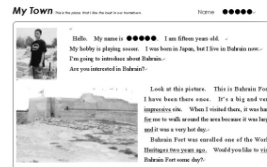
「砂漠」バハレーン日本人学校生徒作品

規模は小さいが、このような自己表現活動を各単元の前にできるだけ位置づけて実践している。卒業を控えた中学3年生の学習の最後には「This is the place I like the best in my school.」という自己表現活動を行っている。生徒たちは「自分の学校で一番好きな場所」について関係代名詞を用いて表現する。多くの生徒が3年間の思いを込めた作品を完成させる。この活動も「表現意欲」を高める効果的な指導の一例であると考えている。