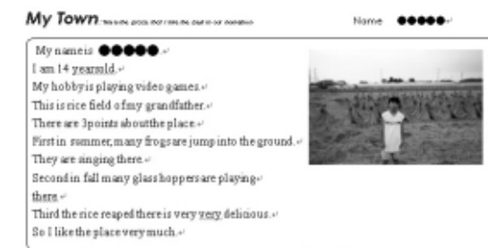
「田圃」本校生徒作品