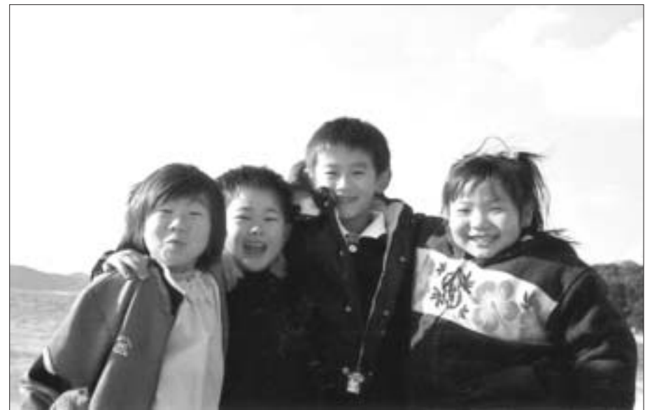
全国へ映画(DVD・有料)を貸し出しています。 問合せ:いせフィルム 03-3406-9455 http://asami.babyblue.jp/ (予告編アリ)

家庭科の観点からは、食育、保育、家族・家庭、地域とのかかわり、幼老交流、キャリア教育などの要素が詰まっています。授業でも活用できます。