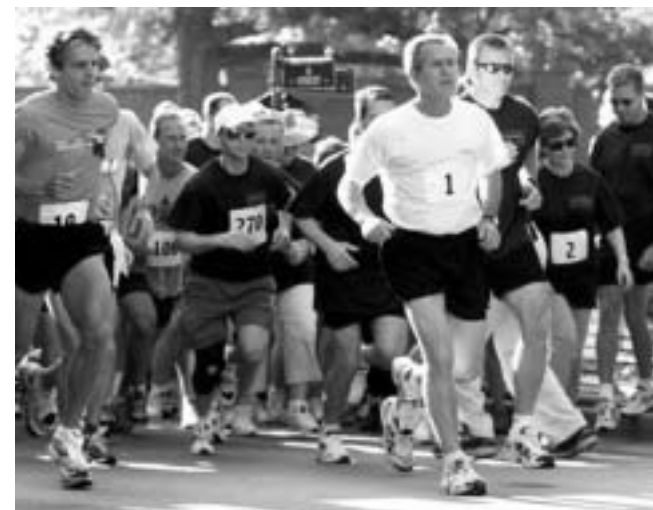
大統領のフィットネス・チャレンジの一貫として、大統領が3マイル走を始めるところ(大統領夫人は1.5マイル徒歩を開始)。2002年。政府「より健全なアメリカ」ホームページから。

肥満は先進国どこでも問題となっているが、アメリカはその際たる国である(図)。2003 - 4年の統計を見ると、2 - 19歳の17.1%が体重過多であり、成人の32.2%が肥満であった