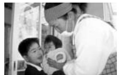
文部科学省選定映画 「ボクラの島を忘れない」 (2005年/61分 監督:多田亜佐美)

瀬戸内海に浮かぶ香川県の小さな島・広島島を舞台に、過疎化が進む島の保育所の1年間を追ったドキュメンタリー映画。