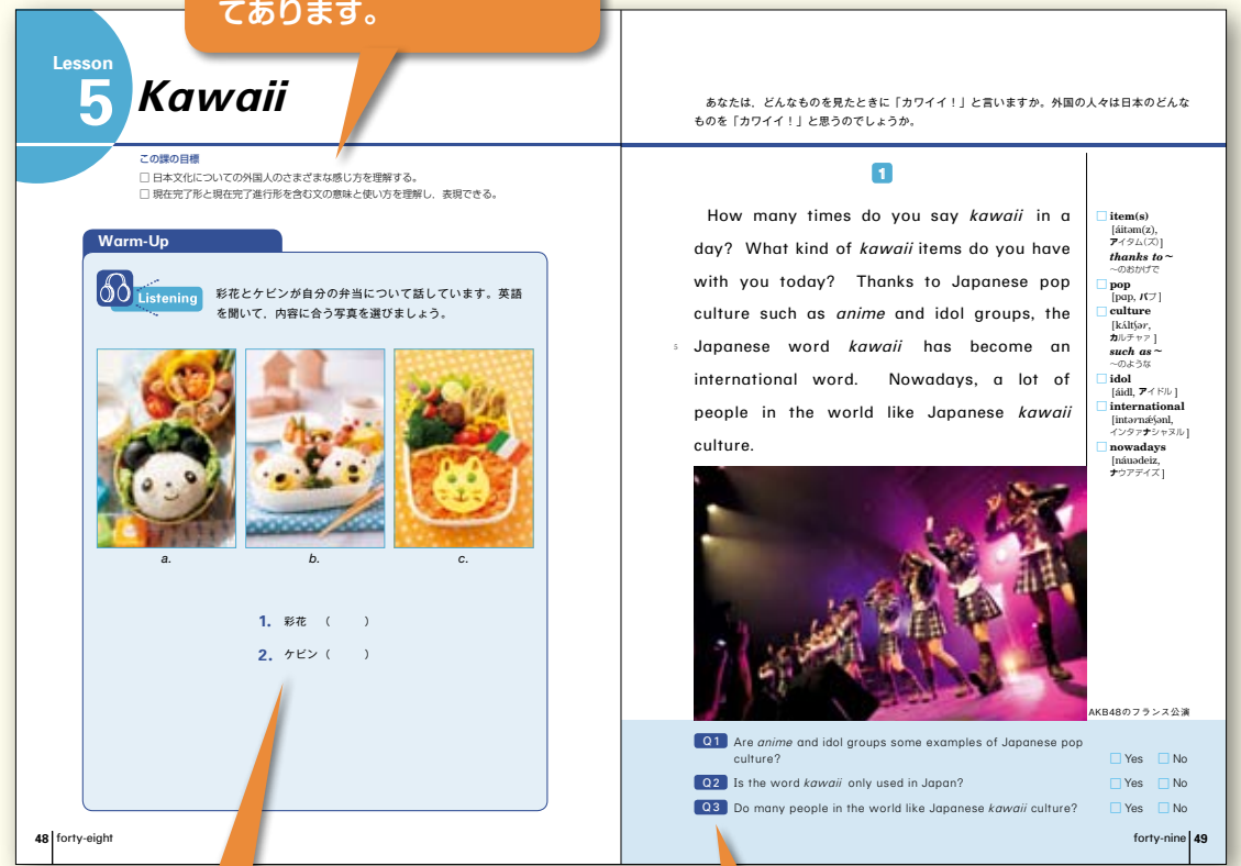
〈I巻 Lesson 5 より〉

はじめに「この課の目標」を示し、目標をもって学習に取り組めるように工夫してあります。