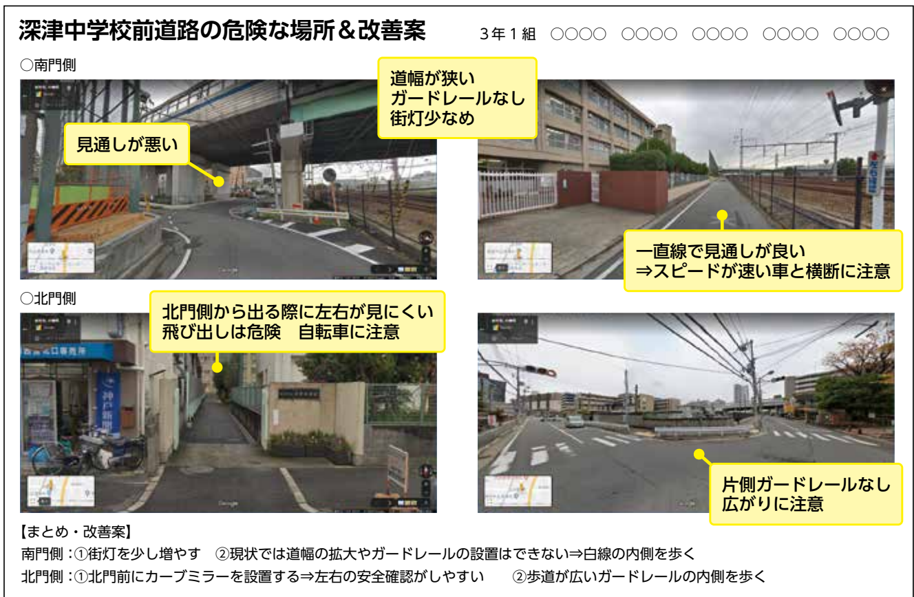
図5 セーフティマップ