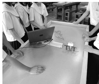
図3 プロカーの制御

「D情報に関する技術」の(3)の内容を学習させるために、図2のようなプロカーの制御を中心に題材を考えた。それは、プロカーは、動かすことについてのプログラムは大変やさしく、生徒の関心を引きつけやすいと考えたからである。さらに、制約のある課題を解決させるためのプログラムを作成するには、より多くの試行錯誤が必要となり、プログラムを作成するための問題解決能力が高まると考えたからである。