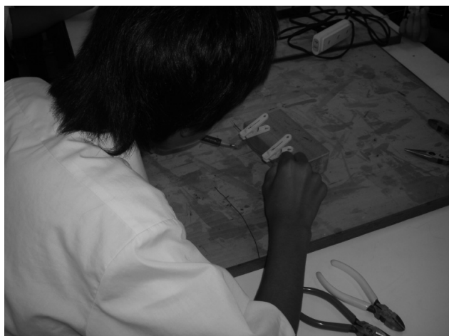
LEDライトの製作：はんだづけ

2年生では、エネルギー変換に関する技術の授業で、名古屋市の南部にある大きな火力発電所に着目し、発電の仕組みや送電の方法などを学習する。その後、蛍光灯ランプからLEDライトの製作を行う。