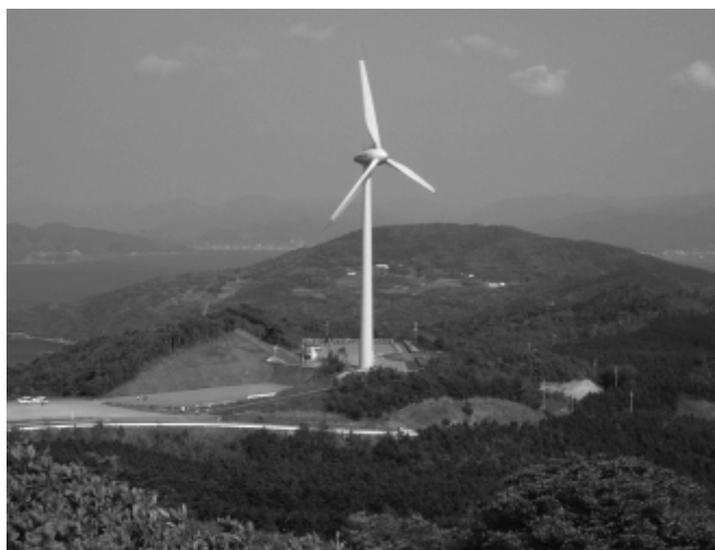
中国電力日置風力発電所

これらのことから技術と環境との関係について考え、代替エネルギー開発の技術に対する適切な評価ができる態度の育成が図られるものと考え。