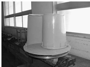
発電機と風車の結合