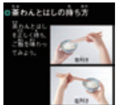
●総ルビ+白黒反転表示の例