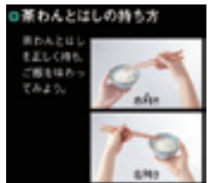
●白黒反転表示の例