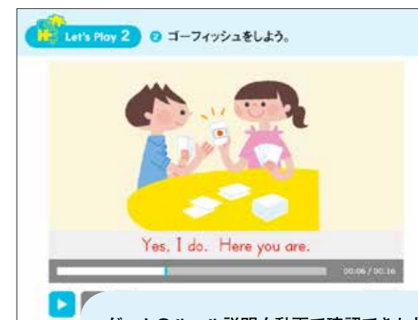
ゲームのルール説明も動画で確認できます。