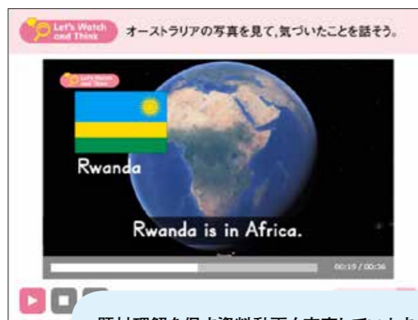
題材理解を促す資料動画も充実しています。