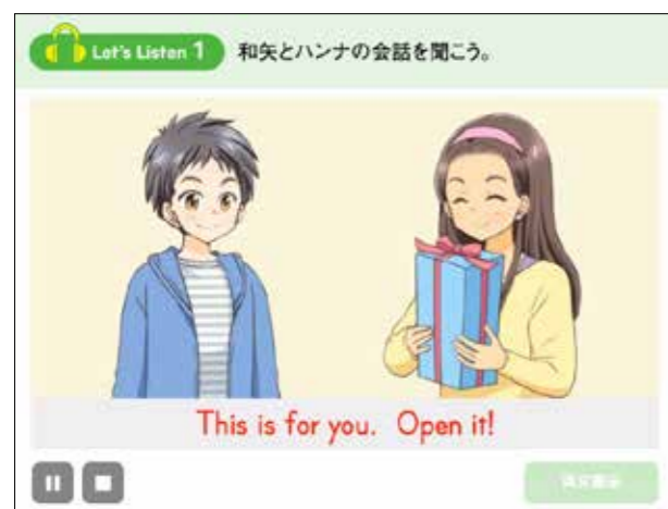
対話のアニメーション

対話は、活動の内容に合わせたわかりやすい アニメーション とともに確認ができます。具体的な場面が想像でき、内容理解や練習に役立ちます。