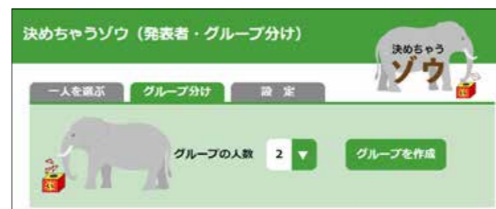
発表者決定アプリ