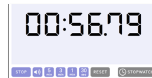
タイマーとストップウォッチ