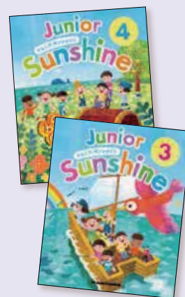
外国語活動用テキスト