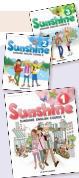
中学校英語の教科書

「語順」「過去形」「単数形・複数形」「外来語」の4つを取り上げています。視覚的な理解ができる構成です。